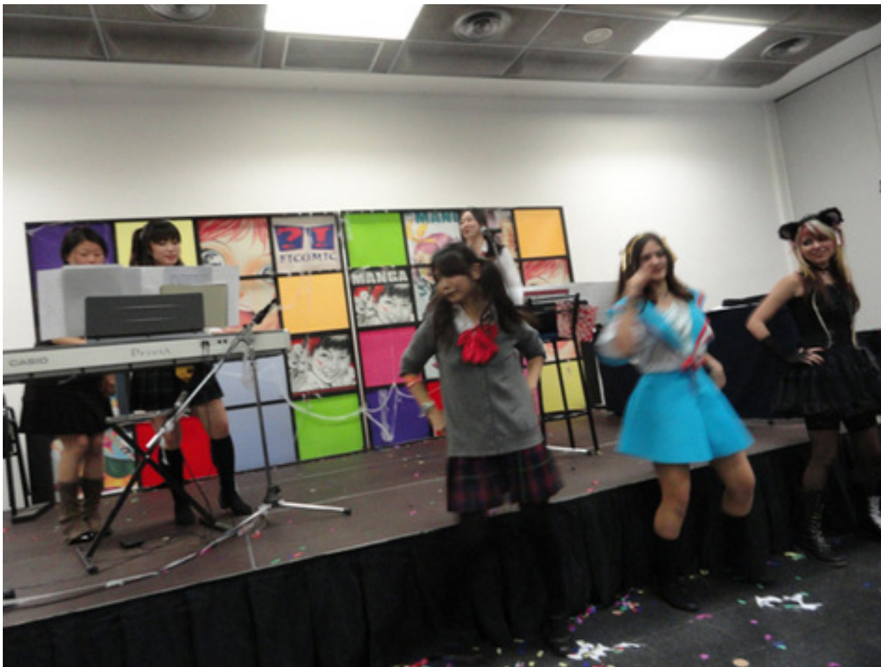
日本人若手女性音楽家4人組によるアニソン公演

ン公演などが行われるほか、メイン会場から徒歩10分ほどの体育館と映画館でコスプレ大会やアニメの上映が行われる。