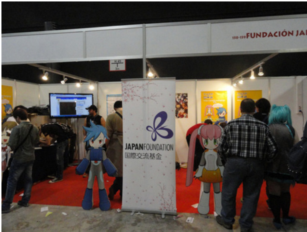
国際交流基金出展ブース

日本語 」の2つのウェブサイトを紹介し、日本語を楽しく学ぶお手伝いを実施中。アテンド要員は主に大学で日本語を学んでいる学生さんたちだが、日ごろの学習成果を現すのはこのときと大いに張り切る。メインキャラクターの「エリン」「ホニゴン」「アグナム」「エミーナ」の4つを等身大フィギアにしてブース入り口に設置したら写真を撮る親子連れなどが多く訪れ、早くも名所ブースに成長中！？