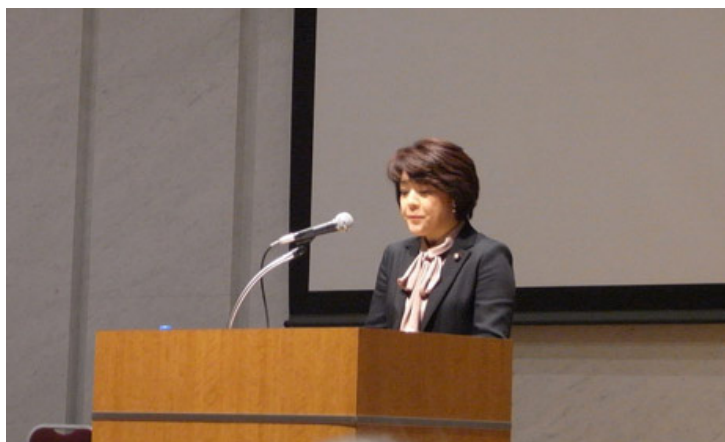
主催者挨拶を行う島尻大臣