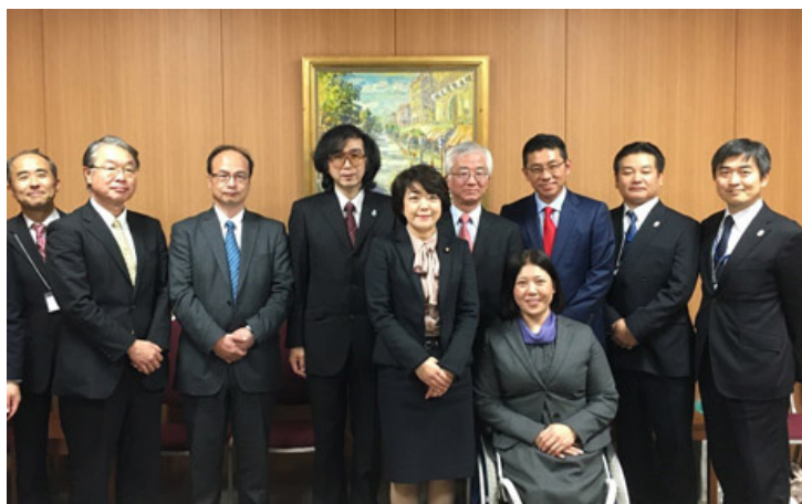
シンポジウム参加者との記念撮影