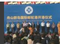
舟山群島國際郵輪港13日正式開港