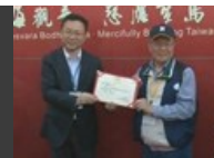
寶島同胞成為首批登港遊客